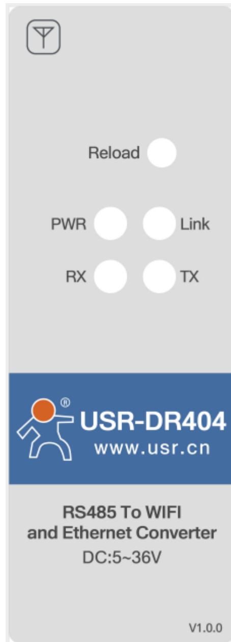
图 2 USR-DR404 串口服务器指示灯和 Reload 说明